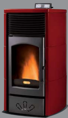
X = 1