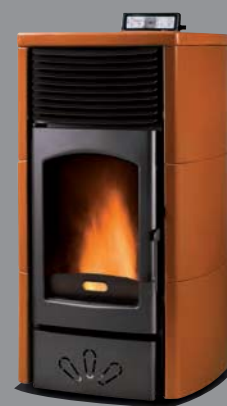
X = 9